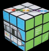
Rubik's 3x3: der Klassiker